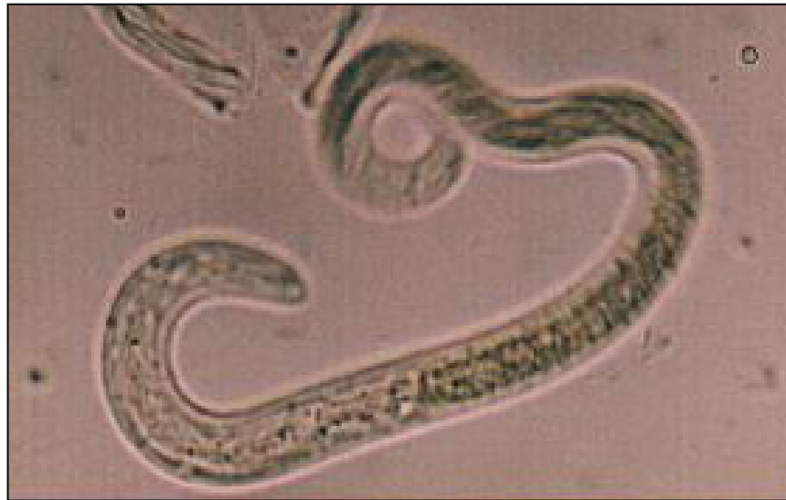
الصورة رقم (1) يرقة فاقسة عن البيضة للوددة T.cati (100x).